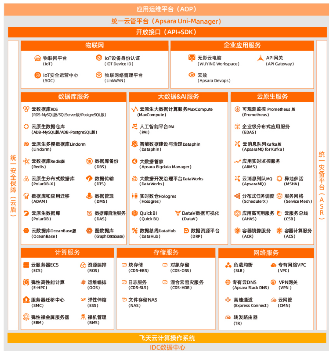
以上为飞天企业版v3.18.1架构示意图