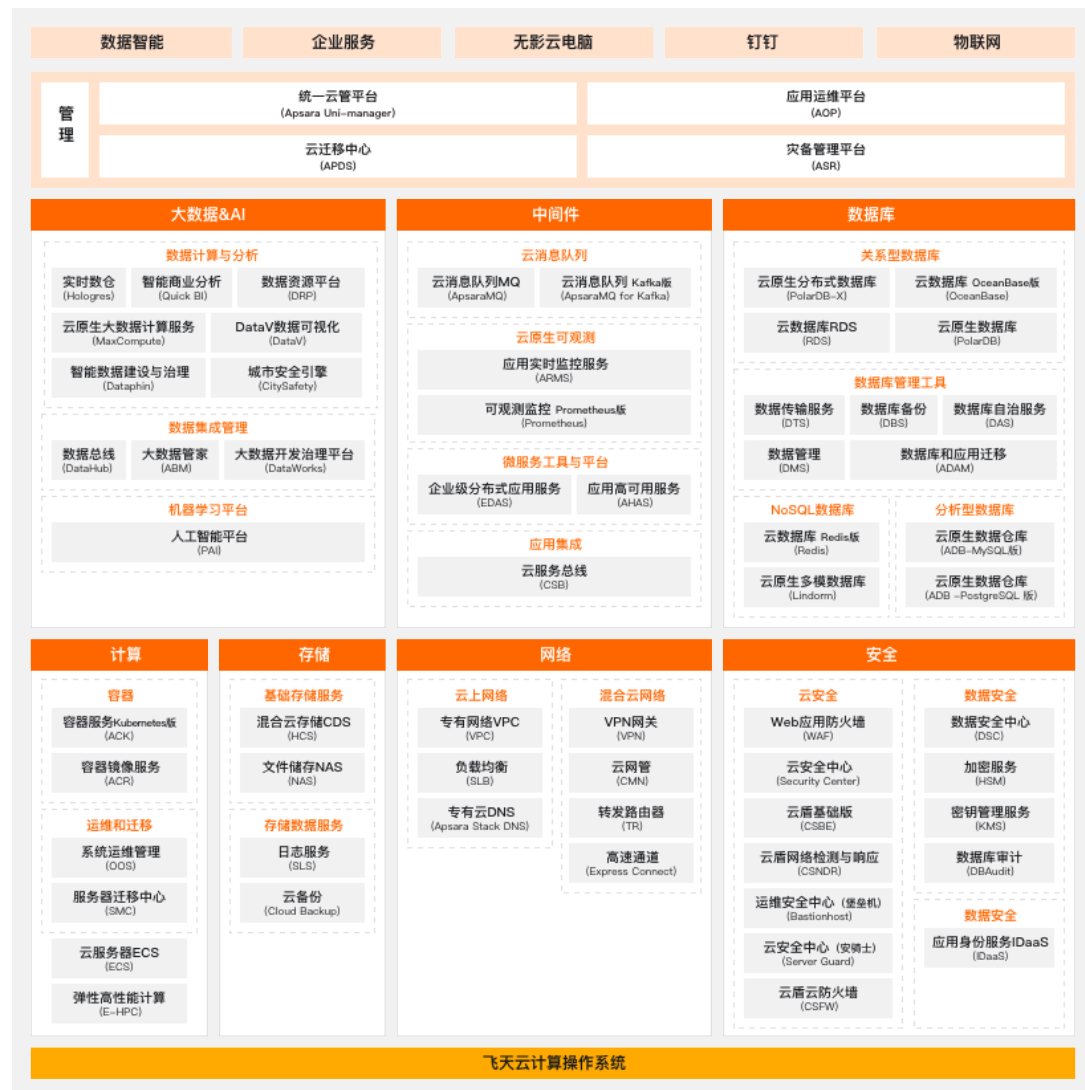
以上为飞天企业版v3.18.2架构示意图